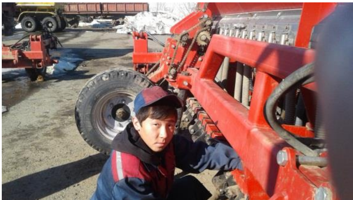
Учебная практика студентов по профессии «Тракторист – машинист» в ремонтной мастерской к/х «Мамбет»