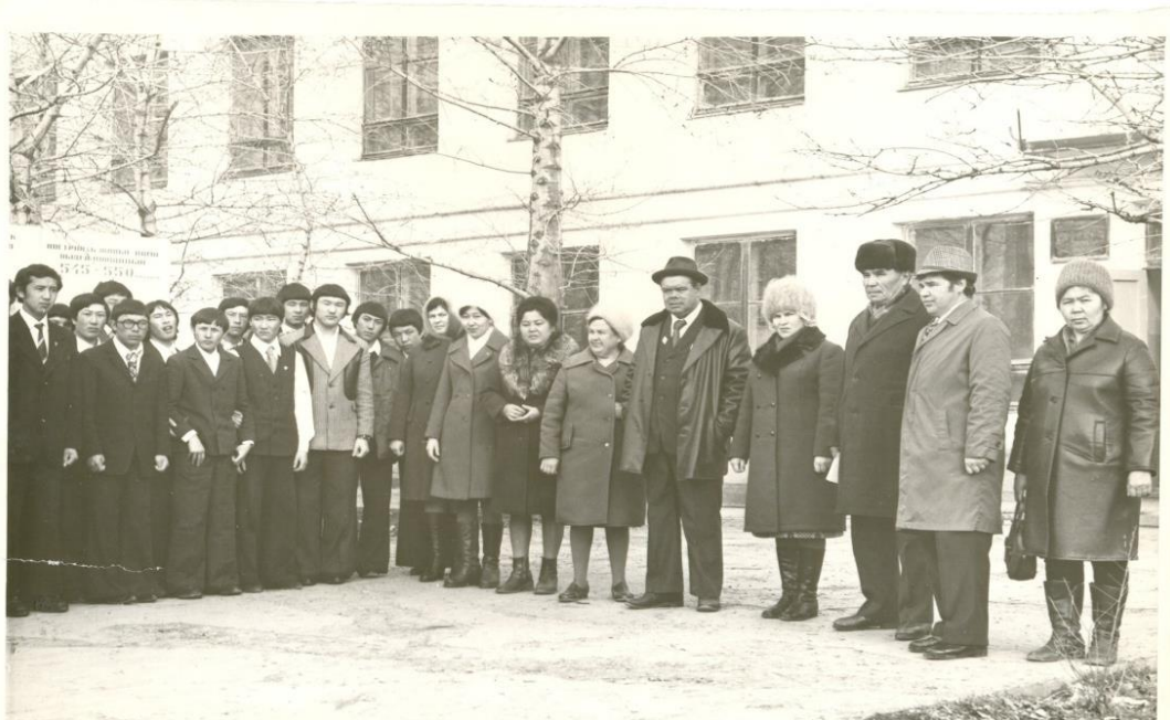
Ежедневная линейка СПТУ №151