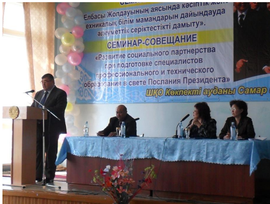
Семинар – совещание 2012 год «Развитие социального партнерства при подготовке специалистов профессионального и технического образования в свете Послания Президента»