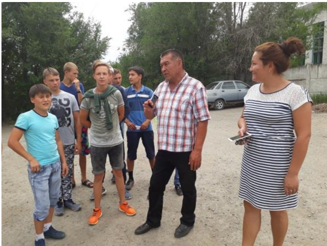
Экскурсия студентов летнего лагеря труда и отдыха в к/х «Мамбет». 2017 г