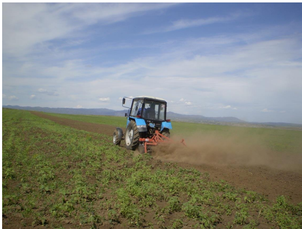
Практика на полях к/х «Колос»