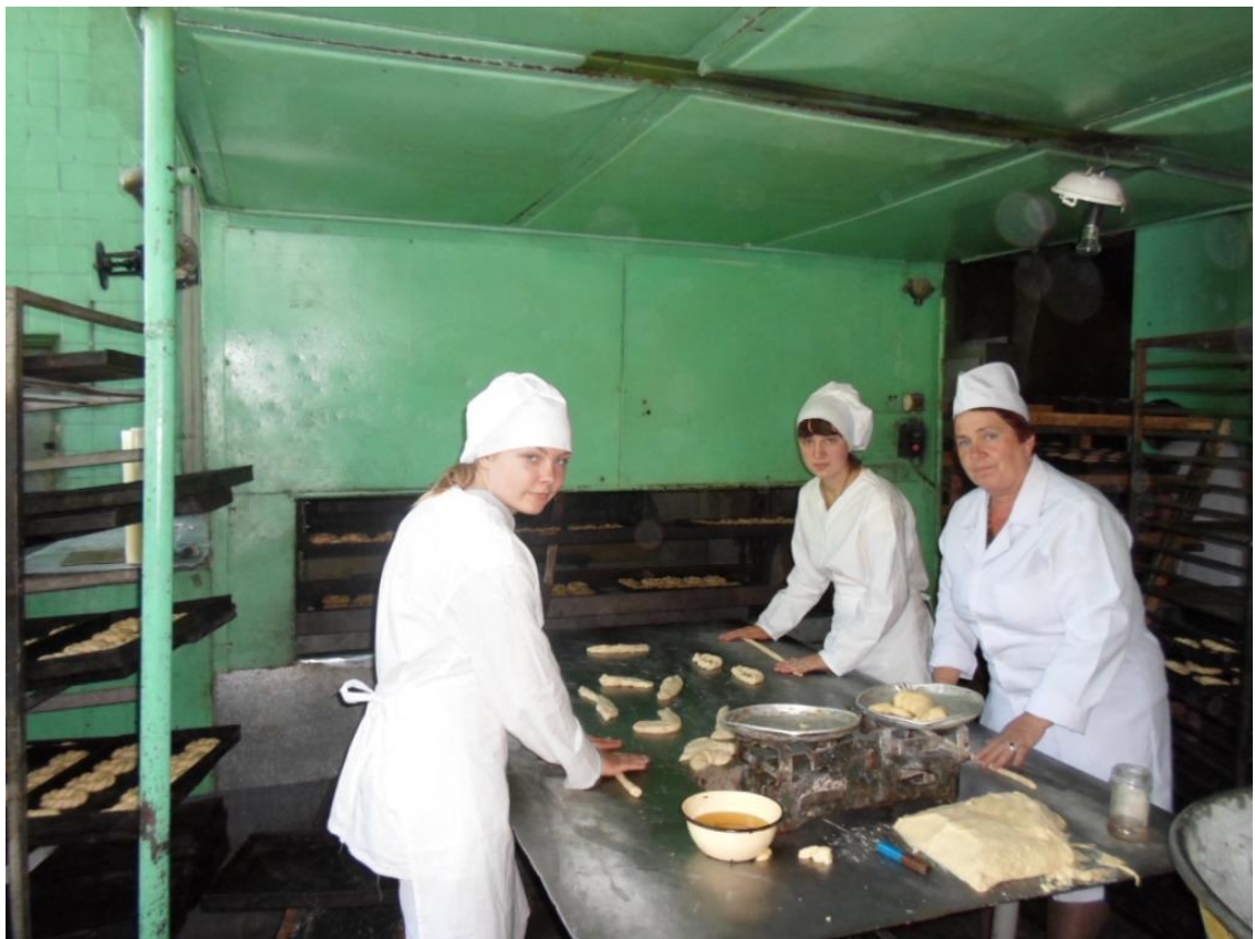
Практика студентов по профессии «Пекарь» на хлебозаводе к/х «Мамбет»