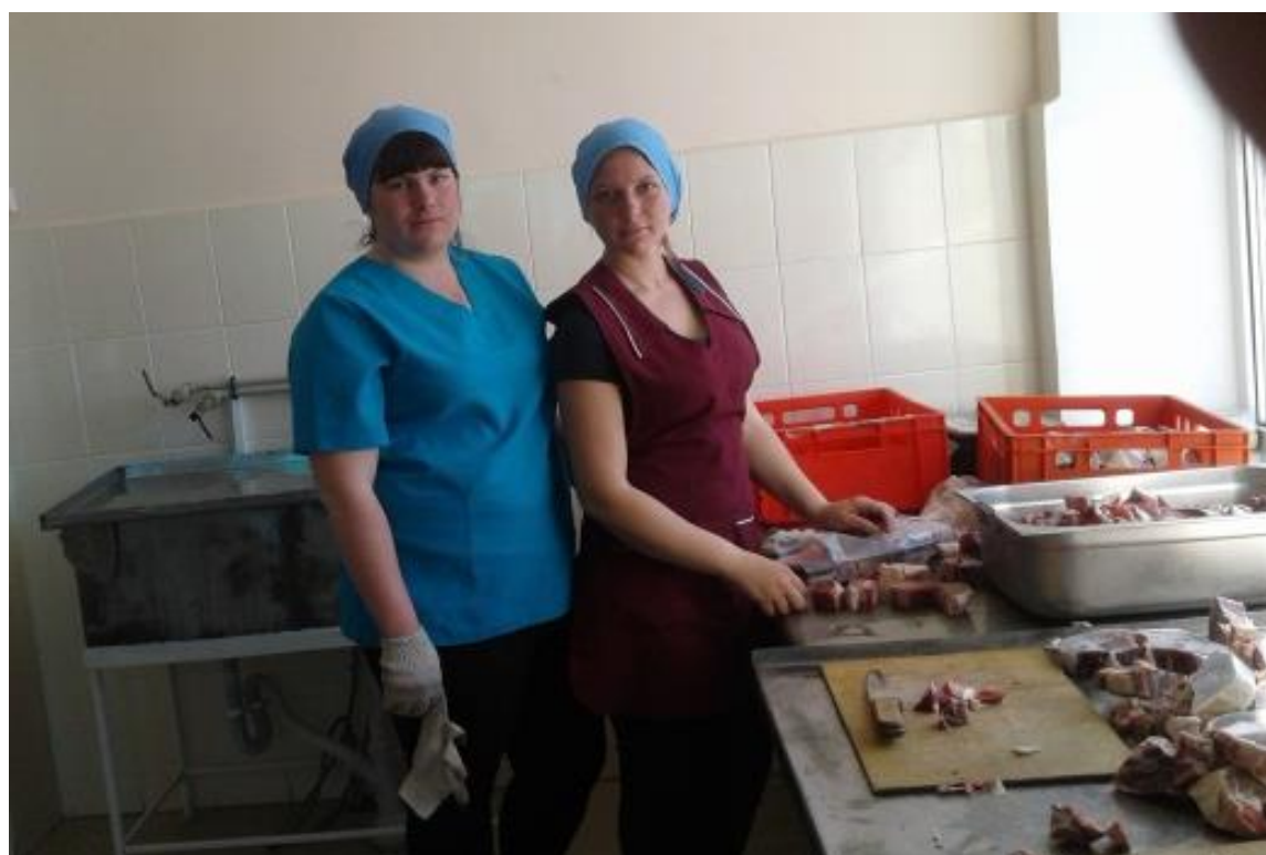
Практика студентов в мясном цехе к/х «Мамбет»