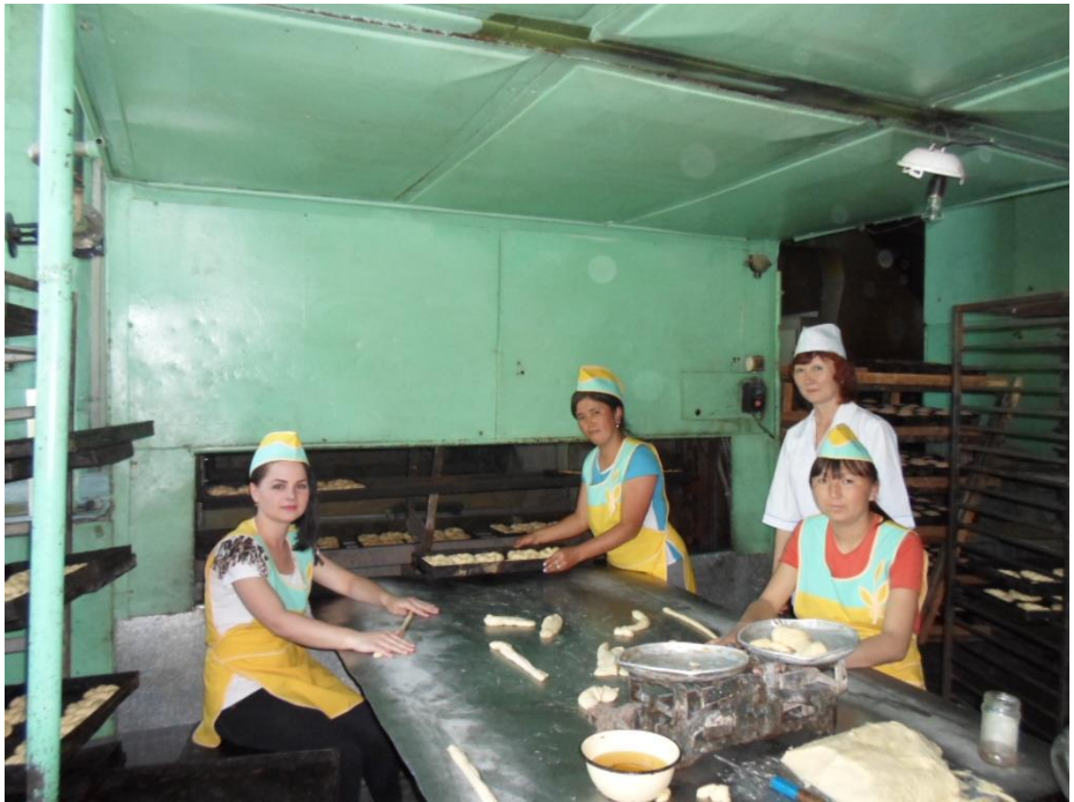
Практика студентов по профессии «Кондитер» на хлебозаводе к/х «Мамбет»