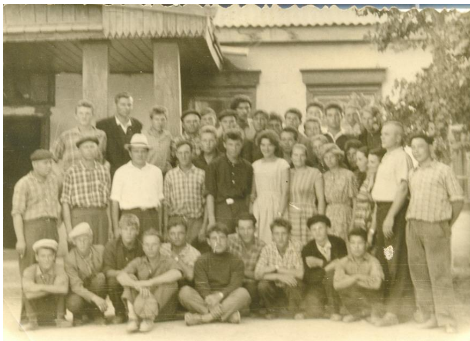
Первые курсанты УМСХ (училище механизации сельского хозяйства) – 1960 г

Из года в год потребность в сельскохозяйственных кадрах возрастала, что вызвало необходимость расширения материально-технической базы учебного заведения были построены: мастерская на 8 единиц техники, общежитие на 40 мест, открыта библиотека, приобретены трактора ДТ-54, МТЗ-5.