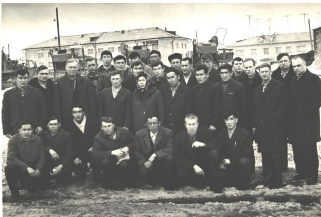
СПТУ - №151 группа мастеров - наладчиков

Курсанты училища обеспечиваются спецодеждой и стипендией в размере 10 рублей.