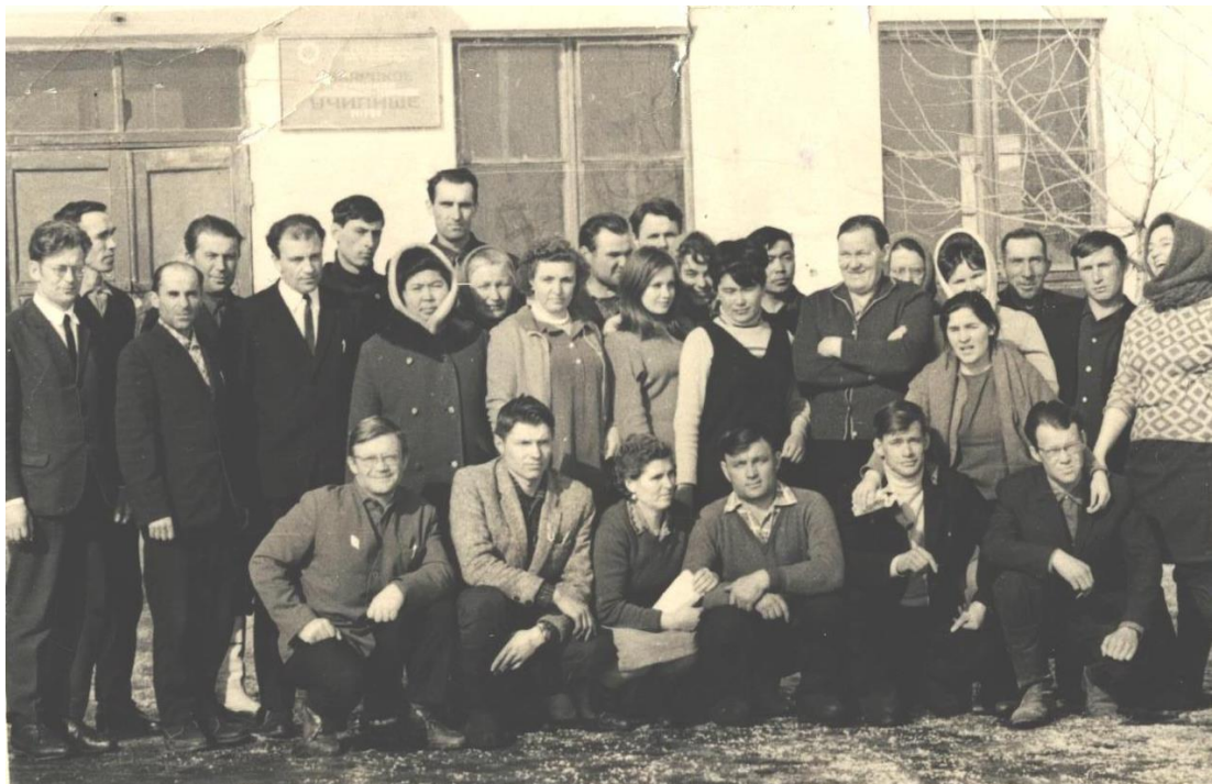
Коллектив УМСХ - №151