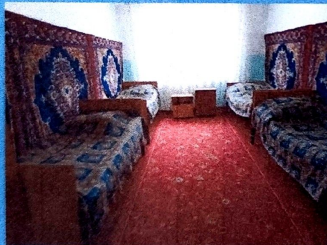
Фото 4 – внутри